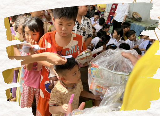
Cadeau pour le nouvel an