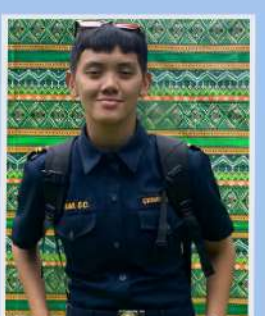
Bundalian, Gelian - 3e année de licence en criminologie